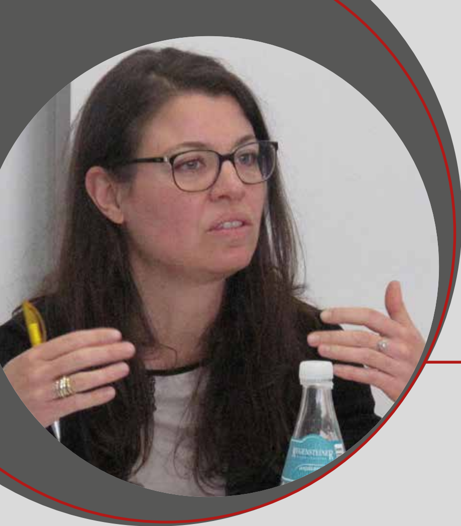
Rena Peterson-Quander, Referentin Gesundheit & Soziales, Fraktion Bündnis 90/Die Grünen im Landtag Brandenburg